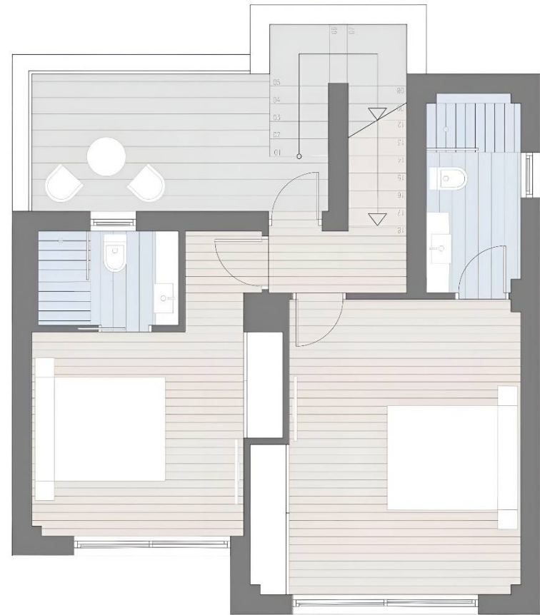
PLANTA PRIMERA. 52,73m2 construidos totales

*NOTA: Este documento tiene caracter de información comercial, sujeto a modificaciones por necesidades de obra, de obtención de licencia, o aquellas que pueda estimar en su momento la dirección facultativa, no siendo en consecuencia vinculante desde el punto de vista contractual.