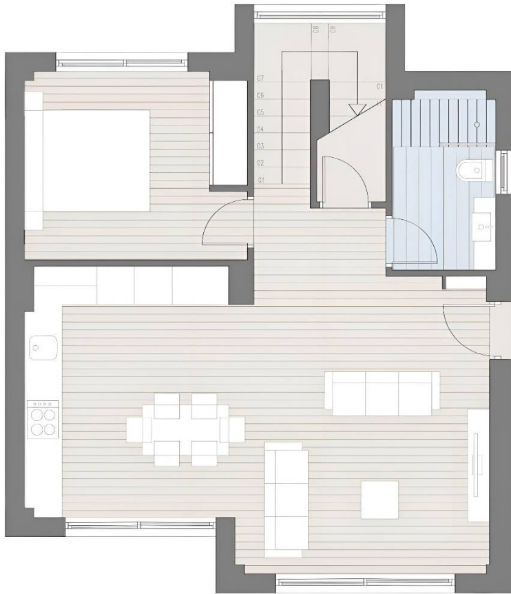
PLANTA BAJA. 66,13m2 construidos totales